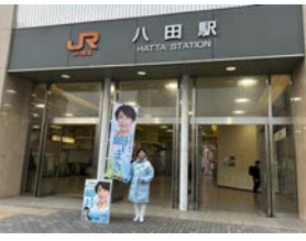
3月4日 地下鉄JR八田駅