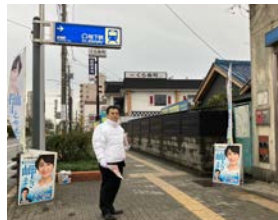
2月23日(金) 地下鉄高畑駅 クリーンウォークデー