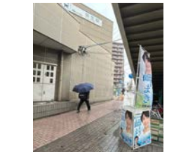
3月12日(火) 名鉄栄生駅