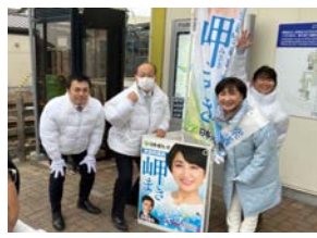
3月5日(火) 近鉄戸田駅