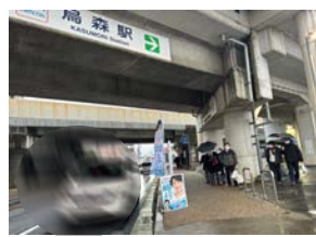
3月6日(水) 近鉄烏森駅