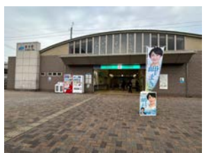
2月29日(木) あおなみ線荒子駅