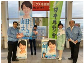
2月22日(木) JR枇杷島駅 維新統一行動デー