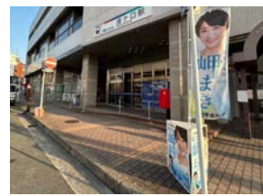
3月15日(金) 名鉄須ヶ口駅