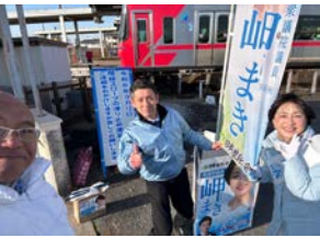
3月11日(月) 名鉄新清洲駅