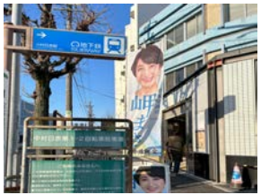
3月13日(水) 地下鉄中村日赤駅