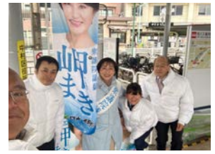
3月8日(金) 地下鉄本陣駅