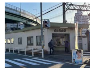
2月28日(水) 近鉄黄金駅