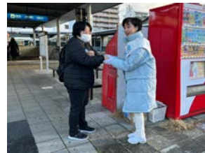
3月1日(金) 地下鉄中村公園駅