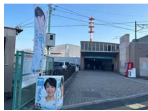
3月14日 あおなみ線小本駅