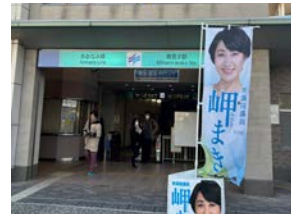
3月7日(木) あおなみ線南荒子駅